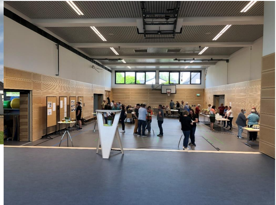
Sanierung Turnhalle mit Bühne